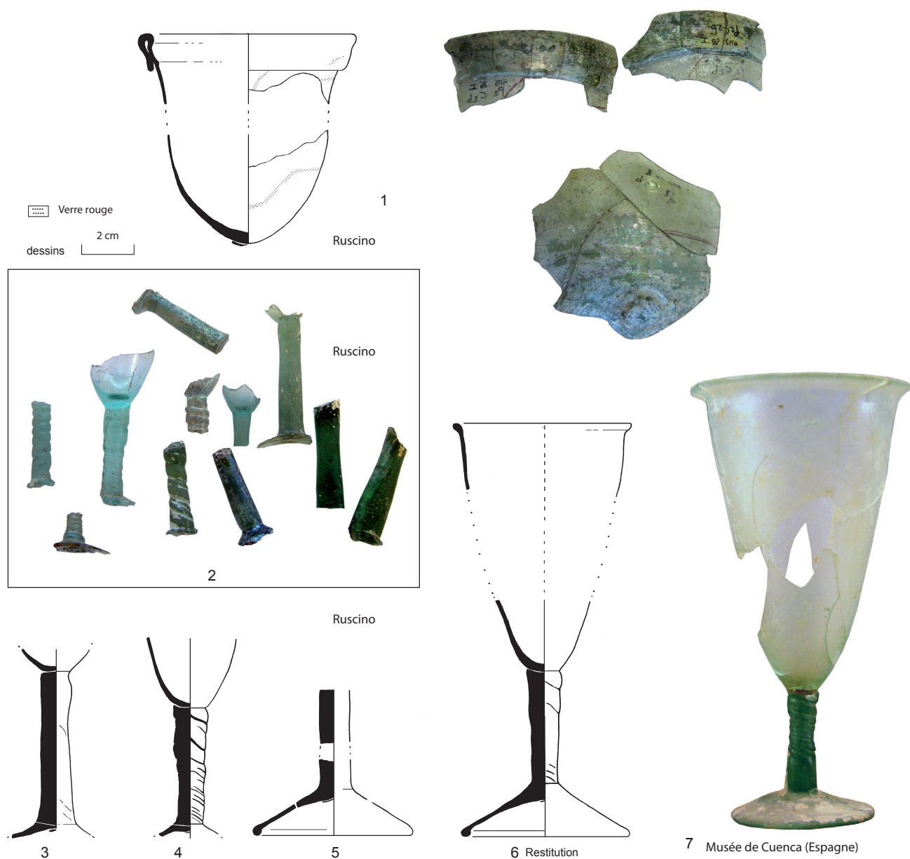
Fig. 1 Palm cups et verres à tige

vraisemblablement une importation septentrionale ; il provient d'une prospection en Camargue sur le site des Combettes dans la commune des Saintes-Maries-de-la-Mer (fig. 2, n° 8). Dans le delta du Rhône, fouilles et prospections ont révélé une densité d'occupations entre le VIII e et le X e s. qui n'a guère d'équivalent ailleurs en Provence (Landuré et al. 2004) ; souvent de courte durée ces installations ont été scellées par les alluvions des crues du Rhône. Une dizaine de gisements ont été répertoriés dont celui du Carrelet où fut découvert une monnaie du IX e s. ou encore celui de Cabassole qui a révélé un galet de verre (Richier 2004, 187).